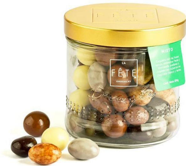
MIXTO Leche y blanco

Selección de frutos secos bañados en chocolate con y sin azúcar añadida.