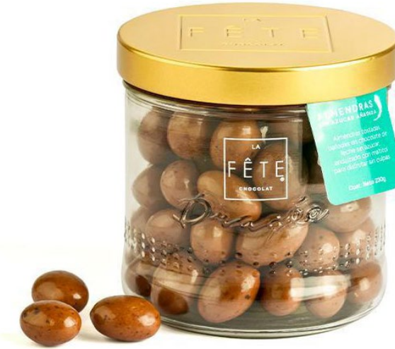
LECHE ALMENDRAS SIN AZÚCAR AÑADIDA