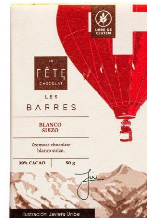
BLANCO SUIZO 39% Cacao