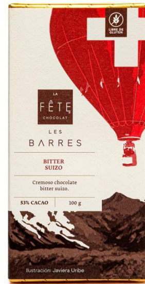
BITTER SUIZO 53% Cacao