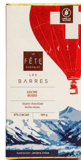
LECHE SUIZO 37% Cacao